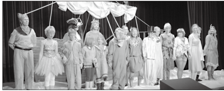
Nach gelungener Premiere löste sich die Spannung bei den Spielern des Laientheaters.