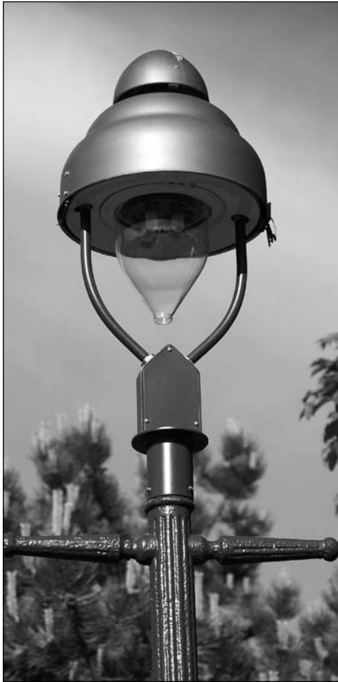
Die „Berliner Lampe“ ist den ursprünglichen Norderneyer Leuchten nachempfunden und kann auf die alten Masten montiert werden.

Die Umrüstung bedeutet eine wesentliche Reduzierung des Energieverbrauchs: Gegenüber der alten Pilzleuchte sei dies eine Einsparung von rund 78 Prozent. Die Wirtschaftsbetriebe erwarten bei der Umrüstung der Beleuchtung in der Nordhelmsiedlung eine Reduzierung des Energieverbrauchs von bisher 72.000 Kilowattstunden pro Jahr (kWh/Jahr) auf 16.000 kWh/Jahr. Die Kohlendioxid-Belastung der Umwelt reduziere sich um rund 36,5 Tonnen pro Jahr durch die bisher 142 installierten LED-Leuchten. Das bedeute, dass jede LED-Leuchte für rund