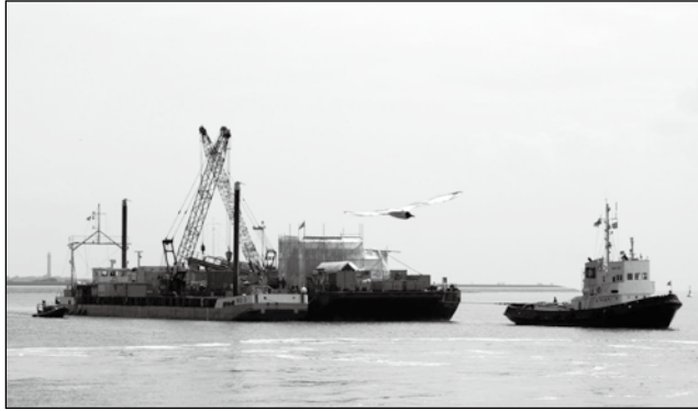
Der Schlepper mit Ponton vor Norderney.

(red) – Ein Schlepper hat am Freitag einen 71 Meter langen und 19 Meter breiten Ponton zu seiner Position im Riffgat südlich von Norderney gebracht. Auf Höhe des Surfbeckens wurde der Ponton an das Arbeitsschiff übergeben und von dort zum Einsatzort transportiert. Der Schlepper hatte zudem die Bohreinrichtung gebracht, mit der die Horizontalbohrung für die Sanierung der Erdgas-Leitung nach Norderney durchgeführt wird. Die Arbeiten im Auftrag der Ewe Netz GmbH sollen bis Juli abgeschlossen sein. Das Unternehmen mit Sitz in Oldenburg investiert in die Leitungssanierung rund 4,4 Mio. Euro.