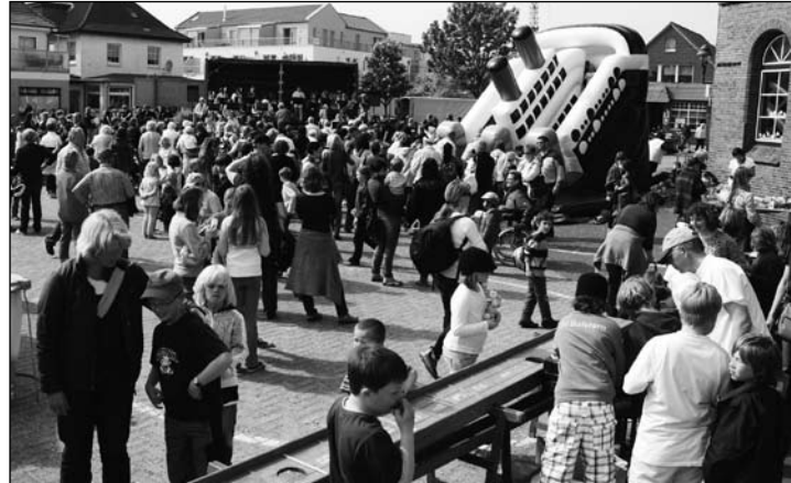
Titanic-Rutsche, Klüterbahn, Musik und viele Aktionen: Das Sommerfest des Förderkreises war eine runde Sache.