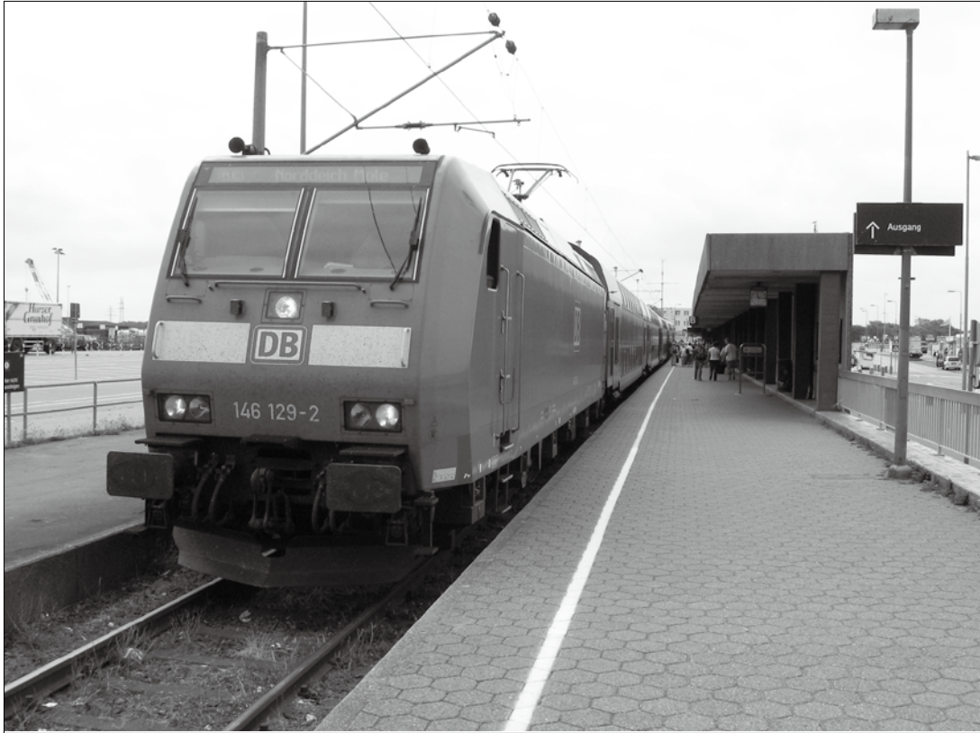
Ein regionalexpress im Bahnhof Norddeich.