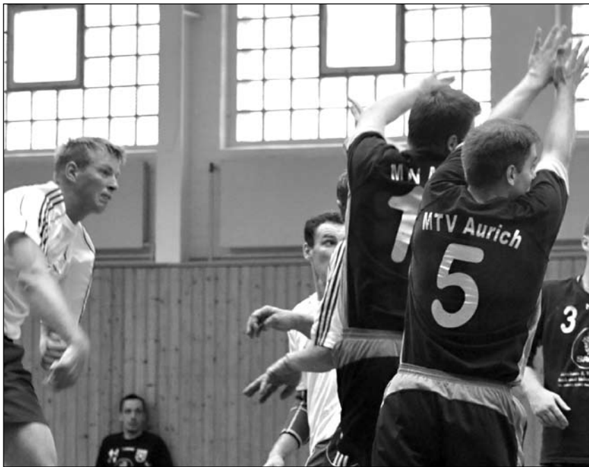
In der letzten Viertelstunde bäumten sich die Handballer des TuS Norderney noch einmal auf.

(der) – Mit 19 zu 20 unterlagen die Handball Herren am Samstagmorgen nachmittag gegen den MTV Aurich. Dabei sah es zu Beginn gar nicht nach einem so knappen Ergebnis aus. In der ersten Viertelstunde waren die Gäste klar dominierend. Erst nach einer Viertelstunde kam das Team der Insulaner, das ohne seinen Trainer Jürgen Rahmel (Urlaub) auskom-