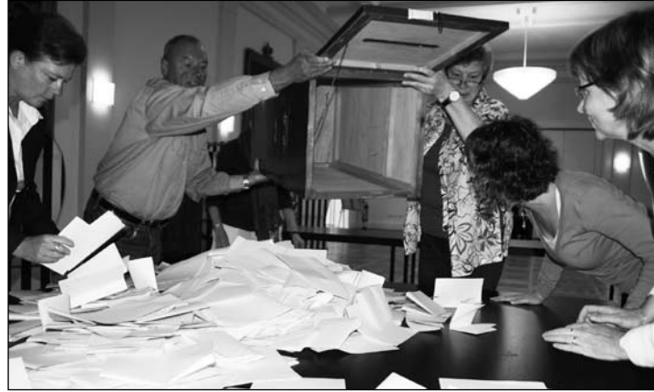
Das Wahlteam im Conversationshaus prüft, ob die Urne leer ist.

(vel) – Garrelt Duin (SPD) hat im Landkreis Aurich mit 44,3 Prozent vor Reinhard Hegewald (CDU), 25,8 Prozent, gewonnen. Thilo Hoppe (Grüne) kam auf 11,1 Prozent, Martin Heilemann (Die Linke) auf 10,1 Prozent und Cornelia Debus (FDP) auf 7,2 Prozent. Auf Norderney ist das Ergebnis nicht ganz so deutlich: Duin bekam 40,3 %, Hegewald 34,2 %, Thilo Hoppe: 10,5 %, Debus: 9,4 %. Die Wahlbeteiligung lag mit 3.530 Wählern bei 72,66 Prozent.