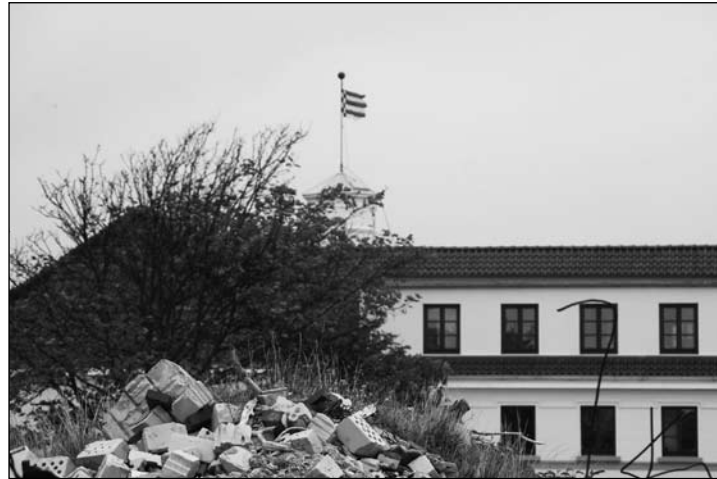
Die Norderney-Fahne weht über dem Conversationshaus – und über dem Schuttgelände.