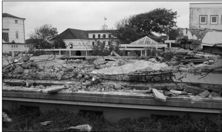
Berge von Schutt auf dem eingezäunten Gelände neben Badehaus (links) und Conversationshaus (geradeaus).