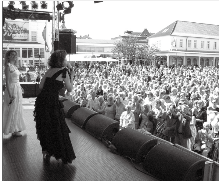
Vor einem Jahr: „Baccara“ singt „Yes Sir I can Boogie“

Der WDR 4 Schlager-Express feiert Jubiläum. Bereits zum zehnten Mal setzt sich der Tross in Richtung Norderney in Bewegung. Aus diesem besonderen Anlass wurde der Aufenthalt auf Norderney verlängert. Der WDR 4 Jubiläums-Schlager-Express startet bereits gegen 5:15 Uhr im Kölner Hauptbahnhof. Weitere Stationen sind in Düsseldorf, Duisburg, Essen, Bochum, Dortmund, Hamm und Münster vorgesehen. Überall steigen noch Schlagerfans zu, die eine der begehrten Karten ergattert haben.