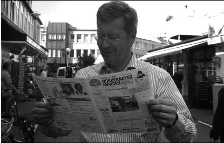
Las täglich den Norderneyer Morgen im Bett: Niedersachsens Ministerpräsident Christian Christian Wulff.

Er selbst hoffe, dass in einhundert Jahren alle Energie von der Sonne komme. Als Ministerpräsident, so Wulff, trage er jedoch auch Verantwortung für die Zeit davor. „Das Wichtigste ist, Energie zu sparen“, so Wulff. Er empfehle, eine sachliche Debatte. Die Landesregierung wolle Ostfriesland als Windkraft- und als Tourismusstandort entwickeln. Zwei Kohlekraftwerke allerneuester Bauart seien dabei keine Gefährdung.