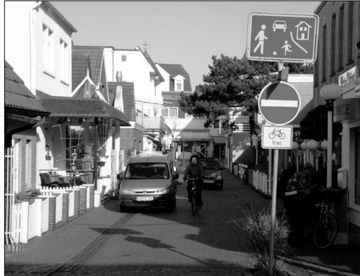
Die Schmiedestraße soll mit der Friedrichstraße Fußgängerzone werden.

(vel) – Die Verkehrssperre, Zonenöffnungen und Fußgängerzonen sind Themen, die viele Norderneyer interessieren. Denn die Sitzung des Ausschusses für Wirtschaft, Tourismus und Verkehr am Mittwoch im Haus der Insel war gut besucht. Außerdem