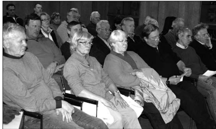
Voller Stadtsaal: Zuhörer der Sitzung am Mittwoch.