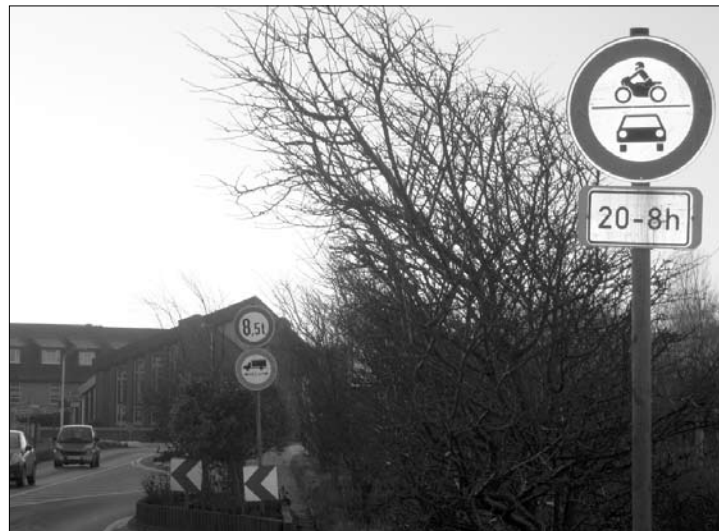
Verwirrende Beschilderung an der Hafensstraße

Ein aufmerksamer Leser machte uns auf die verwirrende Beschilderung an der Hafensstraße aufmerksam. Diese besagt, dass es in der (ehemaligen) Zone I, also im Innenstadtbereich, ein nächtliches Fahrverbot gibt. Das ist falsch. Richtig ist, dass bis zum 4. Januar für den Bereich des Ortskerns ein generelles Saisonfahrverbot gilt und dieser